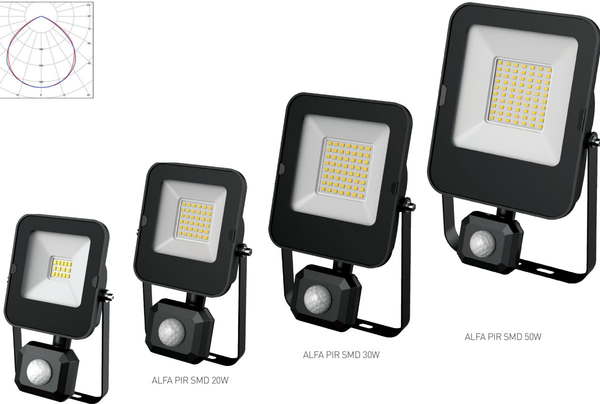
ALFA PIR SMD 10W