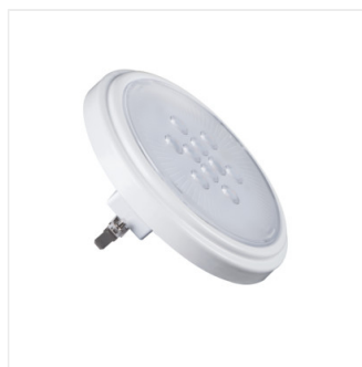
AR-111 LED SL/WW/W