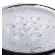
AR-111 LED SL/WW/W