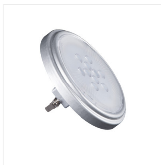
AR-111 LED SL/WW/SR