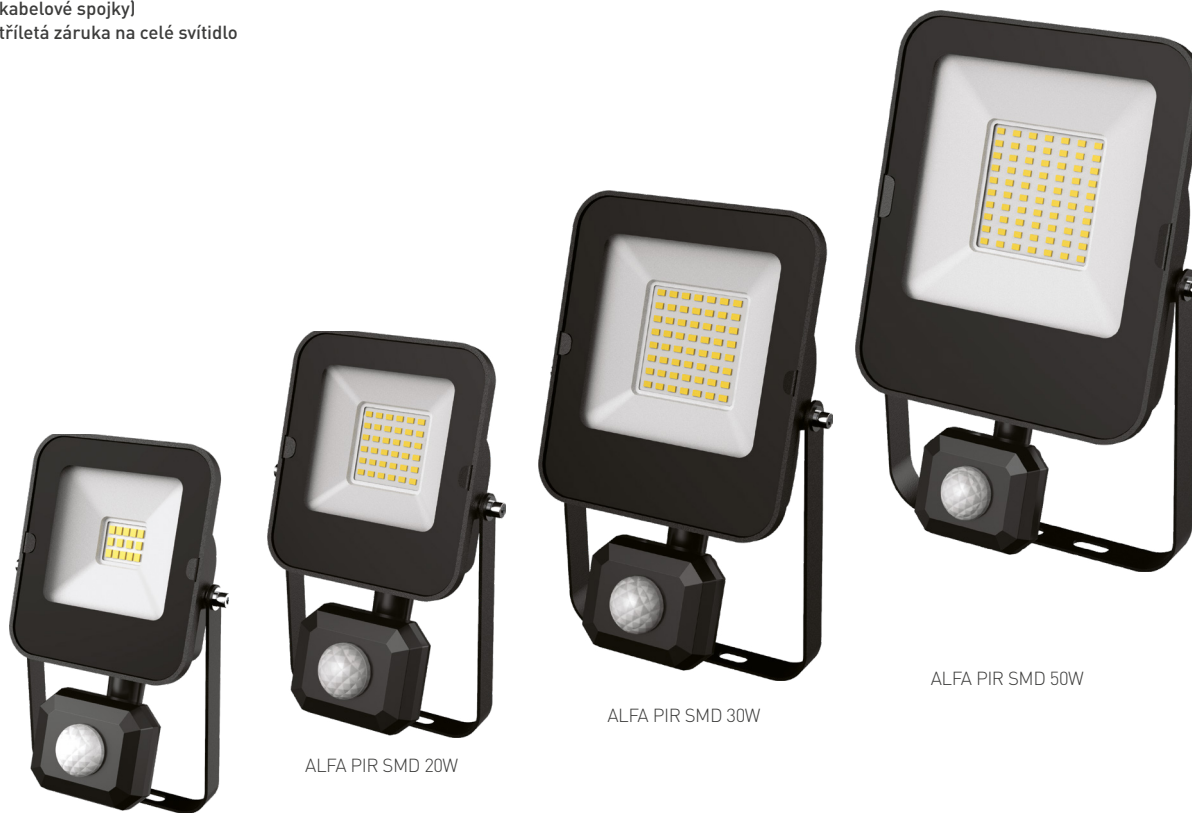
ALFA PIR SMD 10W