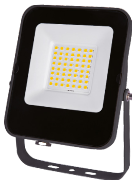
ALFA SMD 30W