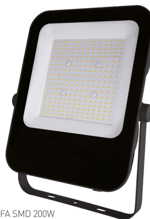
ALFA SMD 200W