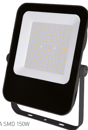
ALFA SMD 150W