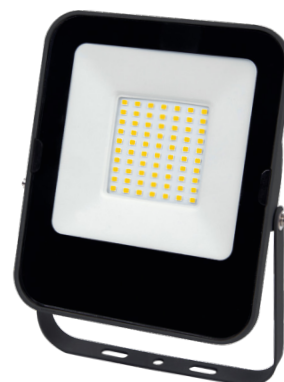
ALFA SMD 50W