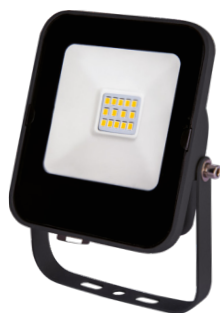
ALFA SMD 10W