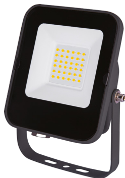
ALFA SMD 20W