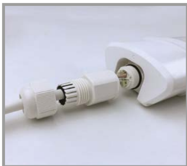
DAISY NECTER 40W NW