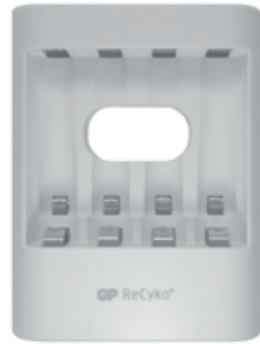
GP PowerBank Charger