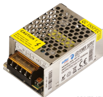
DRIVER 25W/M DRIVER 40W/M DRIVER 60W/M