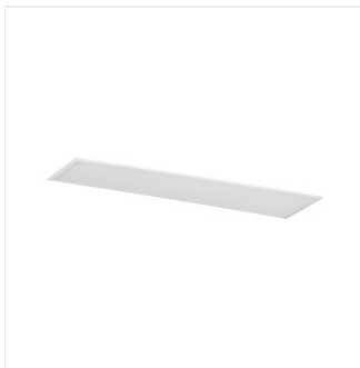
BRAVO S 40W12030NW W