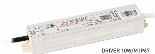
DRIVER 10W/M IP67 DRIVER 15W/M IP67 DRIVER 20W/M IP67 DRIVER 30W/M IP67