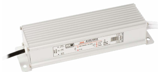
DRIVER 100W/M IP67 DRIVER 150W/M IP67 DRIVER 200W/M IP67