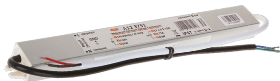
DRIVER 45W/M IP67