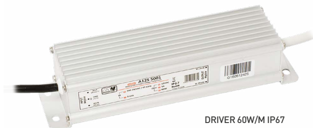
DRIVER 60W/M IP67