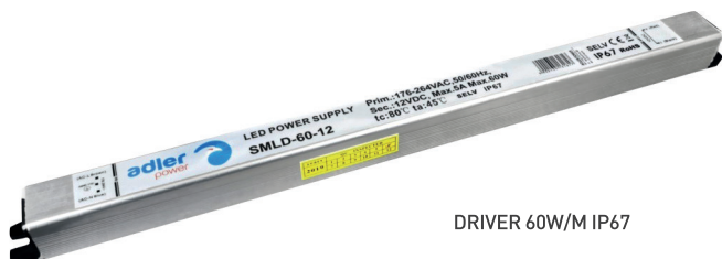
DRIVER 60W/M IP67