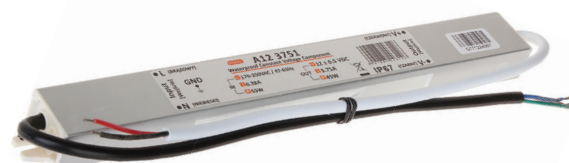
DRIVER 45W/M IP67