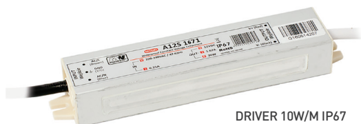
DRIVER 10W/M IP67 DRIVER 15W/M IP67 DRIVER 20W/M IP67 DRIVER 30W/M IP67