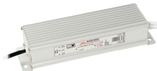
DRIVER 100W/M IP67 DRIVER 150W/M IP67 DRIVER 200W/M IP67